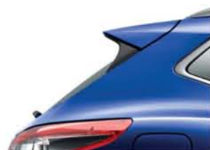
ATRAMENTOWY GRANAT - M - RBN NOWOŚĆ