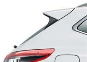
BIAŁY - S - 326