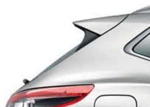
SREBRNY - M - KY0