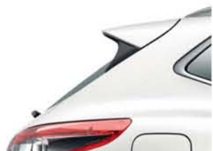
BIAŁY PERŁOWY - M - QAB