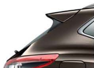
BRAŹOWY - M - CAP NOWOŚĆ