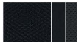
CZARNA TAPICERKA WYKONANA CZĘŚCIOWO ZE SKÓRY