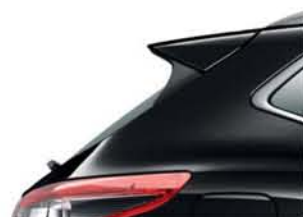
CZARNY - M - Z11