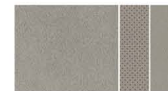
JASNA SKÓRA I TKANINA ALCANTARA