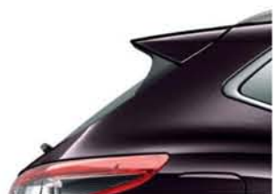
CIEŃ NOCY - M - GAB