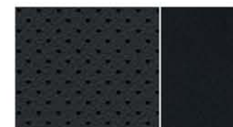
TAPICERKA SKÓRZANA W KOLORZE CZARNYM