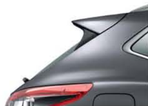
SZARY - M - KAD