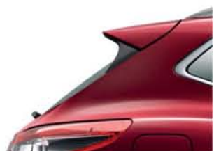
MAGNETYCZNA CZERWIĘŃ - M - NAJ