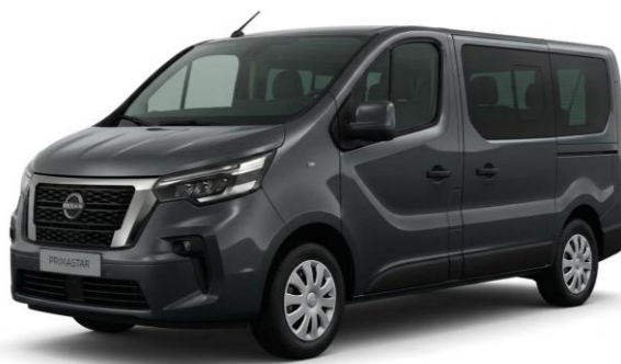
szary – KNA