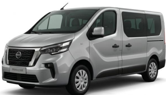
szary Highland – KQA