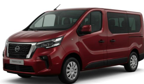
czerwony Carmin – NPF