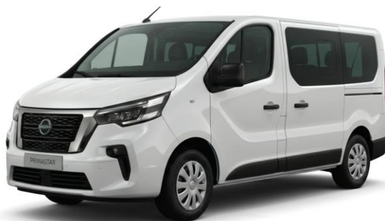
biały – 369/389

Lakiery metalizowane / perłowe – 2 600 zł