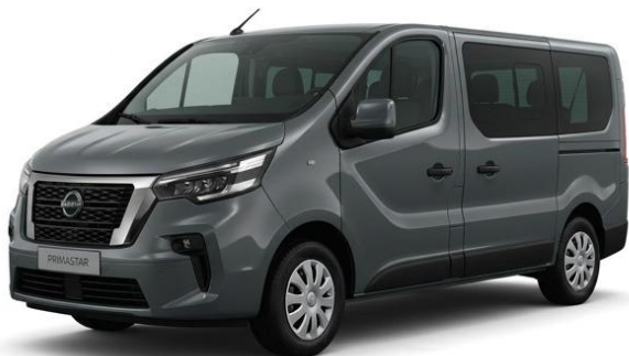
ciemnoszary – KPW