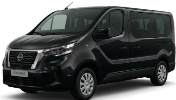
czarny – D68

Lakiery metalizowane / perłowe – 2 600 zł