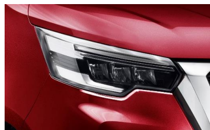
czerwony Carmin – NPF