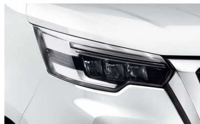
biały – 369

Lakiery metalizowane / perłowe – 2 600 zł