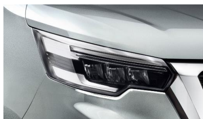
szary Highland – KQA