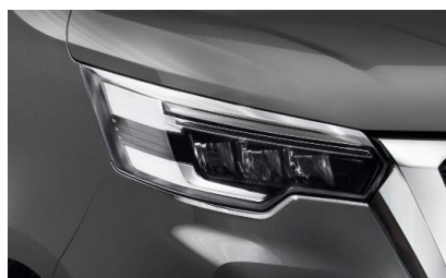
szary – KNA