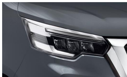
ciemnoszary – KPW