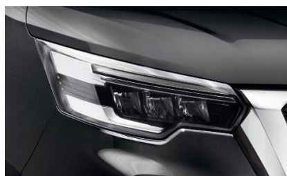
czarny – D68

Lakiery metalizowane / perłowe – 2 600 zł