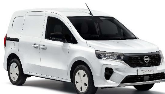
Biały – QNG

Lakier niemetalizowany – dopłata: 976 zł