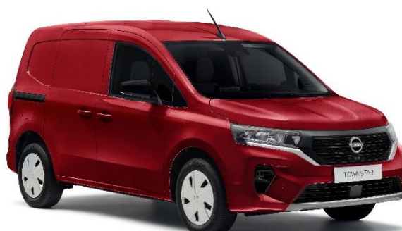
Czerwony Carmin - NPF